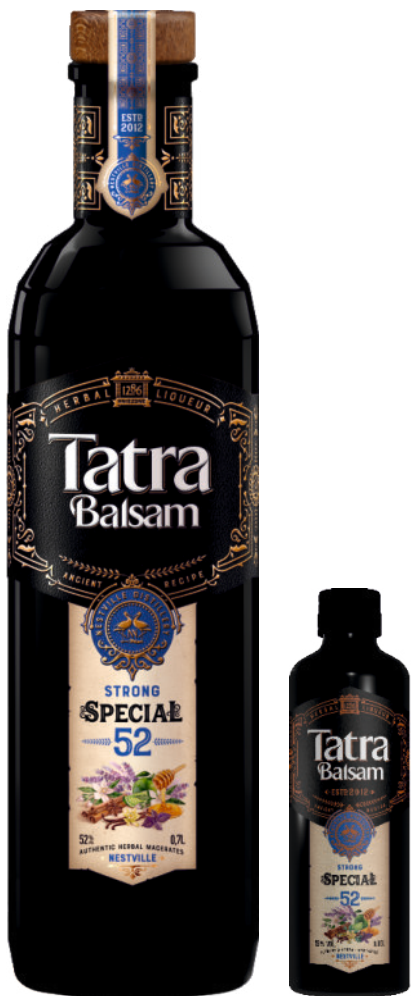
Tatra Balsam Špeciál 52%