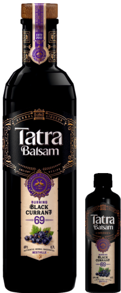
Tatra Balsam Blackcurrant 69%