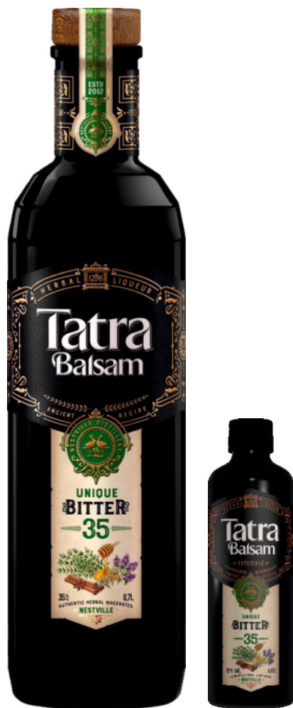
Tatra Balsam Bitter/Horký 35%