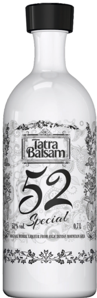
Tatra Balsam Špeciál Keramika 52%