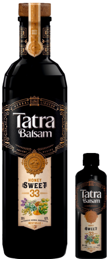
Tatra Balsam Sweet/Sladký 33%