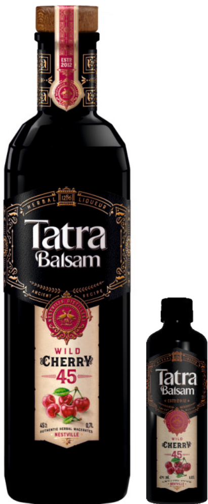
Tatra Balsam Cherry 45%