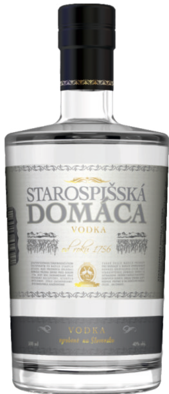
Starospišská Domáca Vodka 40%