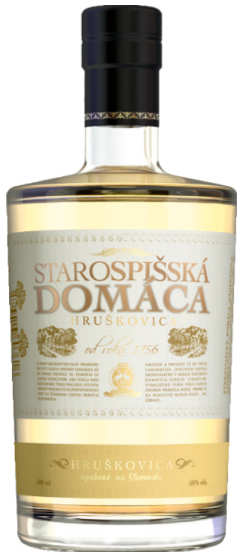
Starospišská Domáca Hruškovica 50%