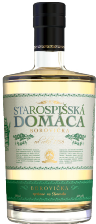
Starospišská Domáca Borovička 43%