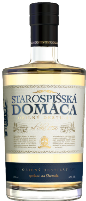
Starospišská Domáca Obilný 50%

Objavte chuť nedotknutej prírody s jemným nádychom po vanilke, dotváranú zrením v dubových sudoch po Nestville Whisky, ktorú v sebe ukrýva poctivý obilný destilát Starospišská Domáca. Pôvodná receptúra pochádza z dávnych receptov našich otcov, ktoré sú datované od roku 1756. Tvrdú prácu predkov na neúrodných hornatých poliach severného Spiša sa podarilo pretaviť do tohto výnimočného zlatistého nápoja.