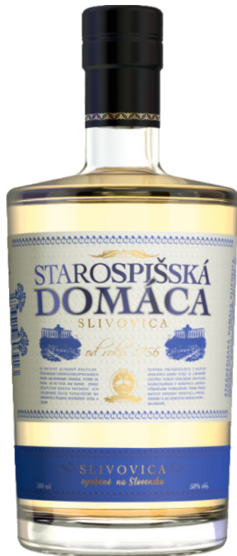
Starospišská Domáca Slivovica 50%