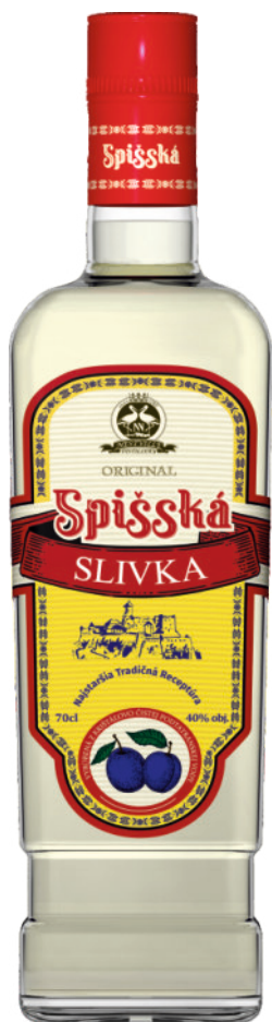
Spišská Slivka 40%