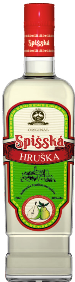
Spišská Hruška 40%