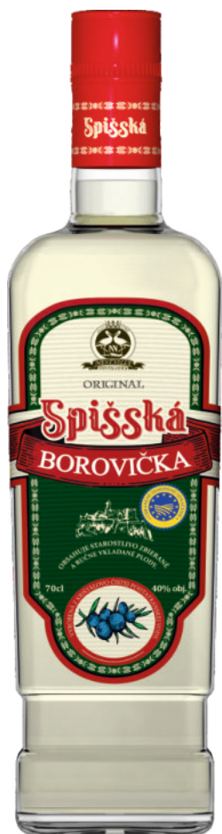
Spišská Borovička 40%