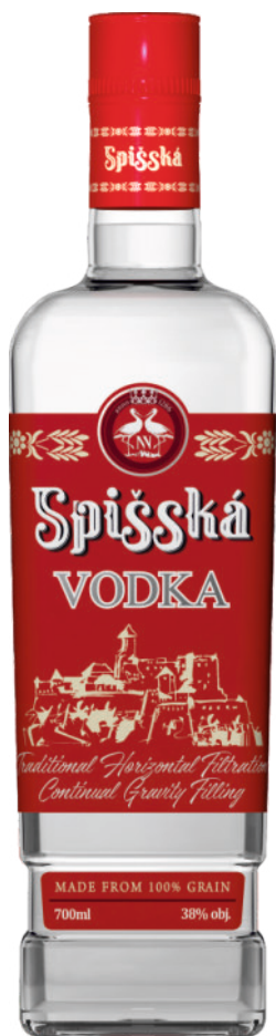
Spišská Vodka 38%